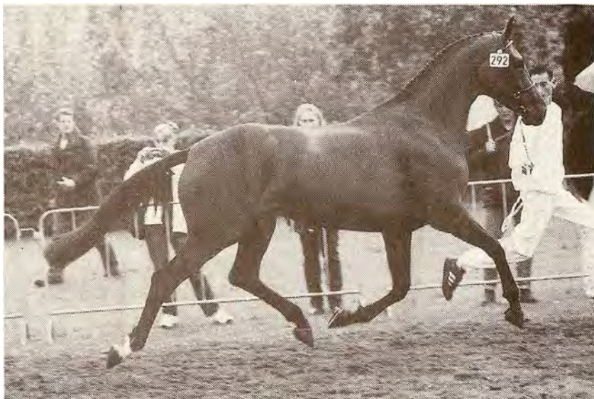
• Royal Irene (Kennedy x Purioso) werd vorig jaar op de nationale keuring in Ermelo bij de driejarige rijpaarden zesde in haar groep,

titie voor Gelderse paarden werd ze alle zes keer eerste. Op dit moment zijn ze bezig om haar de wissels te leren", vertelt Selten.